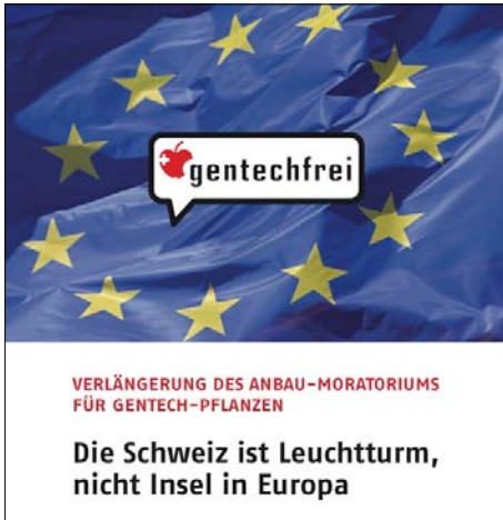
Drei Dokumentationen der SAG überzeugen vom Vorteil des Moratoriums.