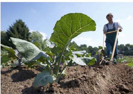
Biologisch gezüchtete Pflanzen sind gentechnikfrei.