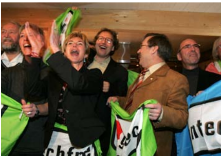
Grosser Jubel beim Sieg in der Volksabstimmung.

Vorbereitung der Abstimmungskampagne: Erstellen des Kampagnenkonzepts, der Kampagnenstruktur und -finanzierung in Zusammenarbeit mit dem Kampagnenbüro. Vorbereitung der Abstimmungskampagne: Aufbau von Regionalgruppen, Produktion von Abstimmungsmaterialien, Bildung von nationalen und kantonalen Parlamentarier-Komitees.