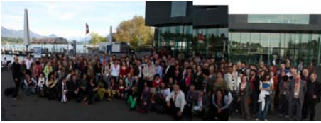
250 Gäste aus 39 Ländern.