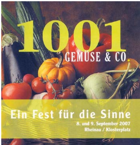
Der Wert und der Schutz der Biosaatgutproduktion wird auf Rheinau gefeiert.