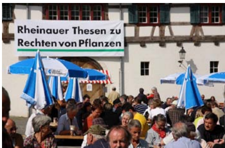
Am 6. September 2008 wurden die Rheinauer Thesen publik gemacht.

Eine Gruppe von interessierten Fachleuten erarbeitet die «Rheinauer Thesen zu Rechten von Pflanzen» und stellt diese einer breiten Öffentlichkeit vor.