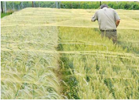
ETH-Feldversuch mit Gentech-Weizen – SAG informiert an Medienkonferenz.

1. September: Medienkonferenz «ETH-Feldversuch mit Gentech-Weizen: ein Misserfolg mit unbeabsichtigtem Nebeneffekt» zur Korrektur der beschönigenden Berichterstattung des Weizenkonsortiums und Notwendigkeit einer Moratoriumsverlängerung.