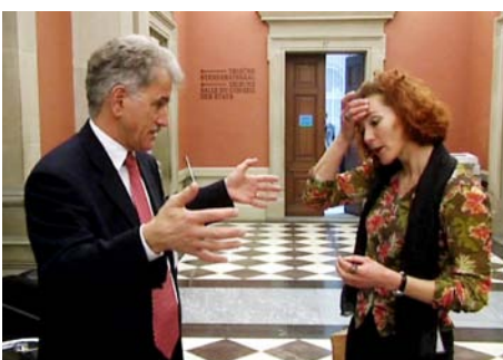
Szene aus «Mais im Bundeshuus»

Das GTG wird vom Parlament angenommen, aber ohne die Forderung nach einem 10-jährigen Freisetzungsmoratorium. Die SAG schafft eine breite Basis von Verbündeten und lanciert die Gentechfrei-Initiative.