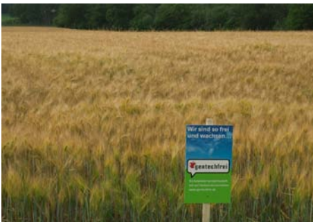
Die Schweizer Landwirtschaft bleibt gentechnikfrei.