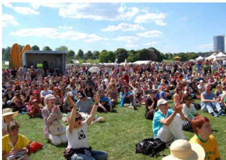
Planet Diversity in Bonn.

Kritische Begleitung des NFP 59 und der damit verbundenen Freisetzungsgesuche.