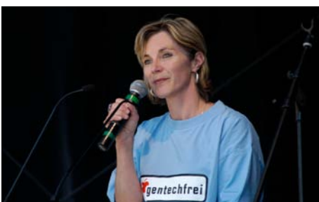
Die SAG Präsidentin an einem europäischen Kongress.

Der Kontakt zu Mitgliedern und SpenderInnen wird ab 2005 neu mit diversen Anlässen gefördert: Sessionsbesuche im Bundeshaus und Exkursionen auf Gut Rheinau.