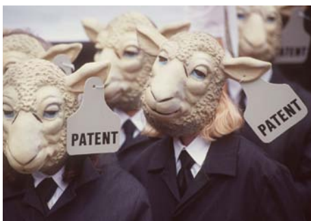
Greenpeace-Aktion gegen die Patentierung von Tieren.

Vorabklärungen für die Lancierung einer Eidgenössischen Volksinitiative mit Verboten von Freisetzen gentechnisch veränderter Organismen, der Herstellung transgener Tiere sowie der Patentierung von Tieren und Pflanzen.