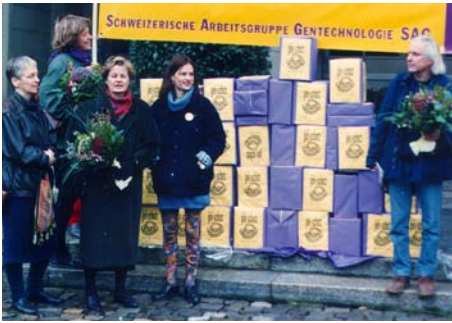
Einreichung der Gen-Schutz-Initiative bei der Bundeskanzlei.